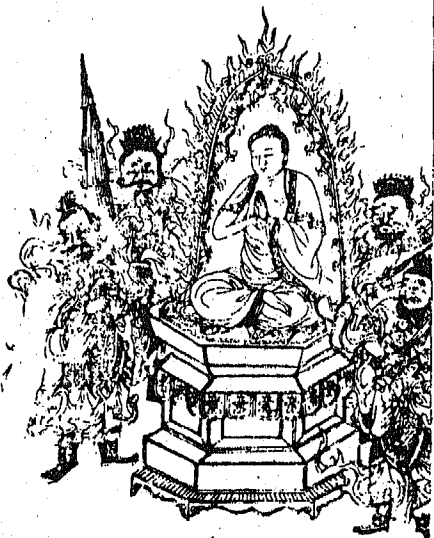
Illustration of a seated Buddhist figure on a pedestal, surrounded by attendants and a flaming mandorla.